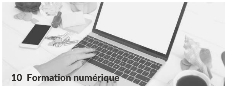
10 Formation numérique