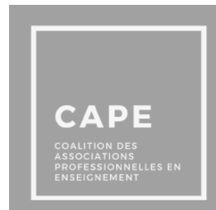
08 La CAPE