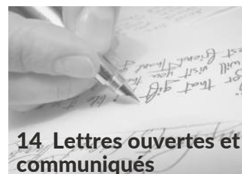
14 Lettres ouvertes et communiqués